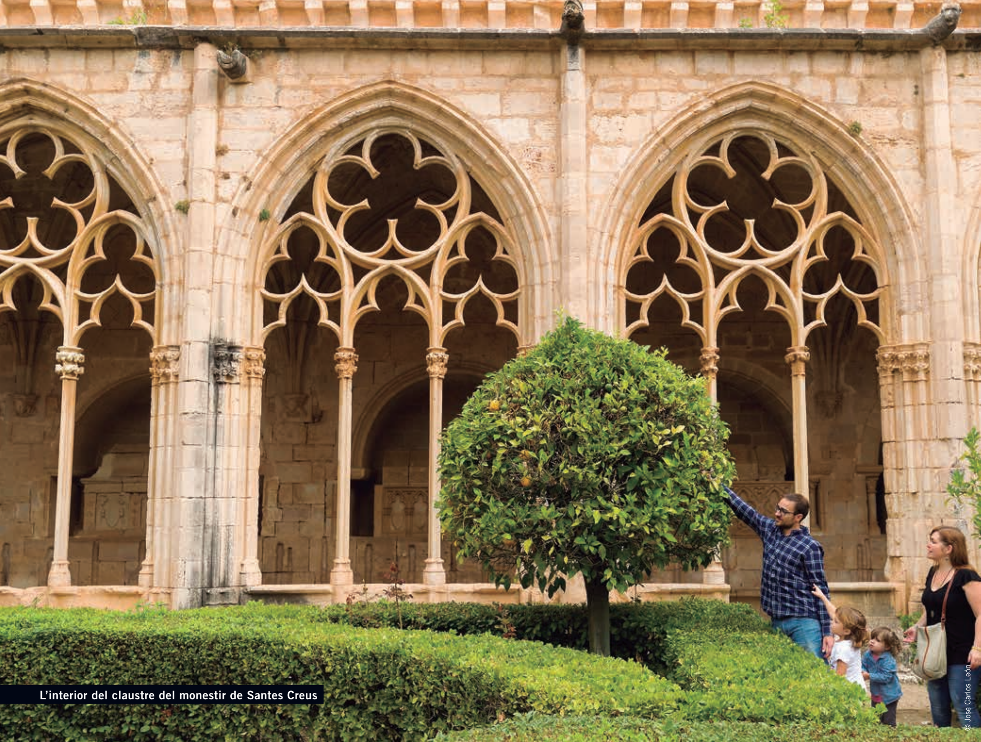
L'interior del claustre del monestir de Santes Creus