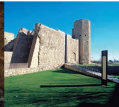
Voltes del circ i pretori