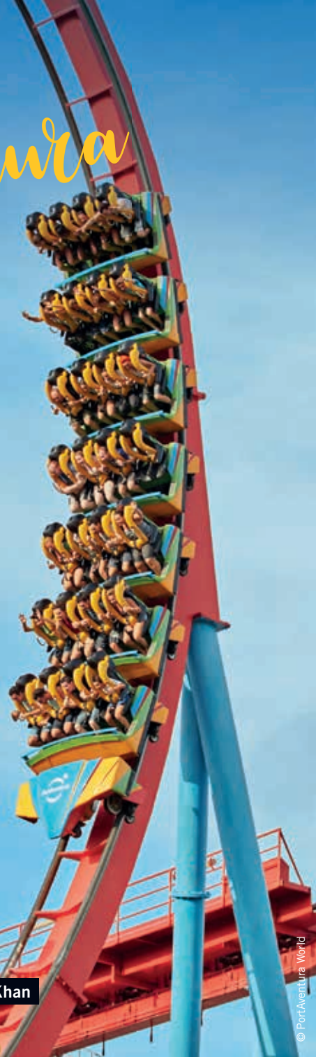
Vuit loopings són l'atracció del Dragon Khan