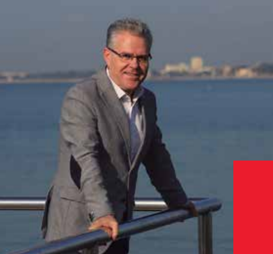
Pere Granados Alcalde de Salou